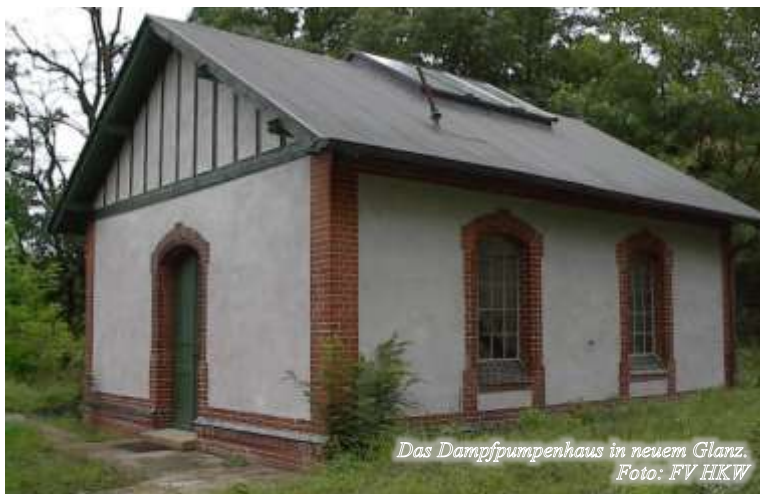
Das Dampfpumpenhaus in neuem Glanz.

Unser Förderverein bereitet nicht nur den Tag des offenen Denkmals am 9. September vor, sondern auch die nächste Mitgliederversammlung. Nach unserer Satzung wird alle zwei Jahre ein neuer Vorstand gewählt, der die Geschicke des Vereins in die Hände nimmt. 2018 ist es wieder so weit: Der neue Vorstand hat alle zwei Jahre viele Aufgaben vor sich, denn die Entwicklung in Beelitz-Heilstätten geht jetzt rasant los und fordert von jedem Eigentümer Kreativität und Engagement. Wir sind Eigentümer des Dampfpumpenhauses, aber nicht des Heizhauses. Das liegt in den schützenden Händen des Landkreises. Wir können nur in dem Rahmen agieren, der „das Denkmal nicht beeinträchtigt“. Deshalb haben wir uns auf die Technik konzentriert und die drei Räume der Besichtigungstour – den Kesselsaal, den Maschinenraum und den Ausstellungsraum (ehemalige Wasseraufbereitungsraum) gepflegt. Die Erweiterungen des Angebotes vor Ort in den drei Räumen haben die Besucher in all den Jahren angelockt und zufrieden gestellt. So werden die Aushangtafeln, die sanierten Aggregate, die stehenden Figuren mit den leicht verständlichen Texten, die weiteren Erläuterungen in den Flyern und den Büchern interessiert angesehen und diskutiert.