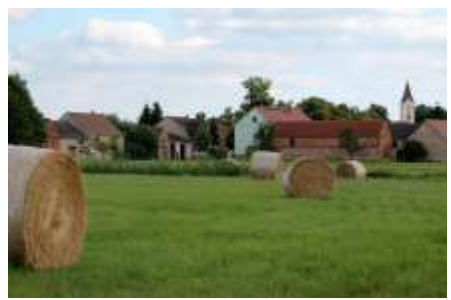
Für die nächsten Wochen soll Rieben nur über den Nachbarlandkreis zu erreichen sein.

Aufgrund von Straßenbauarbeiten ist Rieben seit Mitte März de facto von der Spargelstadt und dem Rest des Landkreises Potsdam-Mittelmark abgeschnitten: Über einen Zeitraum von vier Wochen lässt der Landesbetrieb Straßenwesen die Fahrbahndecke auf der L73 zwischen dem Beelitzer Ortsteil und dem Nachbarort Zauchwitz erneuern, außerdem stehen Erhaltungsarbeiten an den so genannten Amphibienleiteinrichtungen, also den Krötentunneln unter der Straße, an. Verbunden mit den Arbeiten ist eine Vollsperrung der Strecke, die über die zwei Wochen Osterferien sogar den Busverkehr und den Rettungsdienst einschließen soll, was im Ort und in der Stadtverwaltung für Verärgerung sorgt - ebenso wie die kurzfristige Ankündigung der Sperrungen.