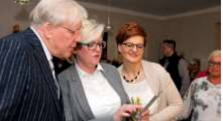
Zur Wahlparty waren viele Stadtverordnete und andere ehrenamtliche Bürger gekommen. Unten: Per Whatsapp gab es das vorläufige Endergebnis.

Beelitz kann wirklich froh sein, so einen Bürgermeister zu haben“, sagte sie. Entsprechend schwierig werde es, nun noch einmal „eine Schippe drauf zulegen“. „Ich fürchte, das erwarten die Leute. Aber wir stehen hinter dir und zusammen werden wir das hinbekommen.“