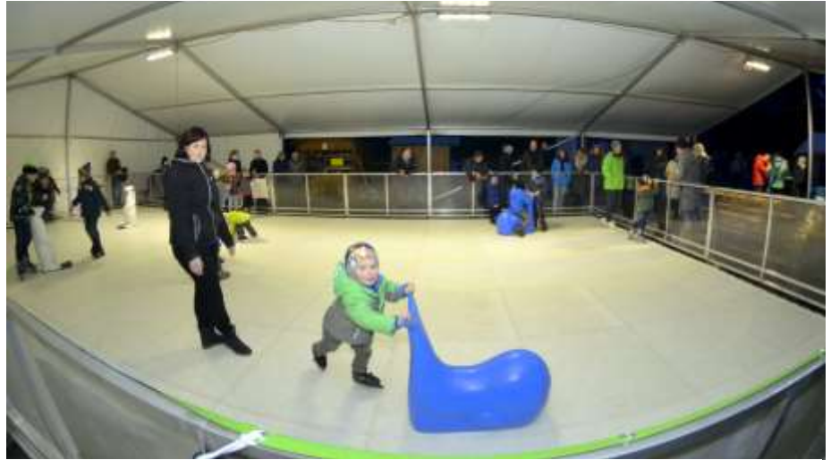
Bahn frei für die nächste Generation im Eiskunslauf: Vor allem die Kinder hatten ihren Spaß auf der Kunsteisbahn. Für das Rahmenprogramm sorgte der Verein „Fiwa Kids“.

„Das ganz Besondere daran war, dass alles ehrenamtlich organisiert und betreut wurde“, würdigte Ortsvorsteher Tilo Köhn. „Über sieben Tage fanden sich Fichtenwalderinnen und Fichtenwalder, die täglich Schlittschuhe ausgaben, die Kanten