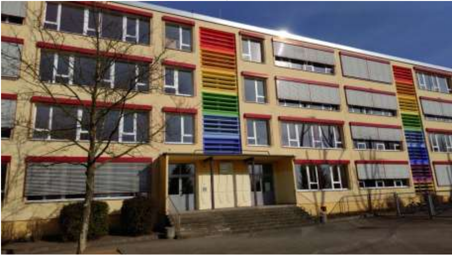
An der Solar-Oberschule soll das gemeinsame Lernen künftig noch leichter möglich sein.

An dem Projekt beteiligen sich seit diesem Schuljahr landesweit 24 Ober-, über hundert Grund- und drei Gesamtschulen. Teil des Projektes ist unter anderem die Einstellung von 432 zusätzlichen Lehrkräften sowie die Begrenzung der Schulklassen auf höchstens 25 Schüler. Als zentrale Elemente beschreibt das Bildungsministerium außerdem ein multiprofessionell angelegtes Personalkonzept sowie gezielte Fortbildung, Diagnostik und Förderung sowie eine langfristige, auf wohnungsnahe Schulangebote in allen Förderschwerpunkten orientierte Schulentwicklungsplanung. An der Solar-Oberschule lernen derzeit ungefähr 270 Schüler, von denen sechs Prozent einen sonderpädagogischen Förderbedarf vor allem im Bereich „Lernen“ haben. Bisher war eine Diagnostik nötig und ein Feststellungsverfahren