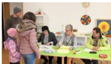
Gut 800 Beelitzer hatten schon im Vorfeld per Briefwahl abgestimmt, ausgezählt wurde dennoch erst ab 18 Uhr. Andere verbanden den Sonntagsspaziergang mit einem Abstecher ins Wahllokal.