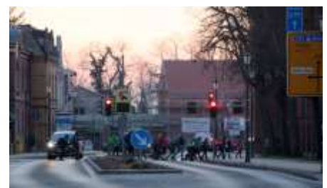
Morgens um 7 Uhr in Beelitz. Nicht immer geht es hier so überschaubar zu.

Viele Grundschüler müssen in Beelitz schon vor Unterrichtsbeginn hellwach und aufmerksam sein: Denn nachdem sie mit dem Schulbus aus dem Ortsteilen angereist sind, gilt es, die manchmal schon morgens viel befahrene Clara-Zetkin-Straße zu überqueren. Dass es dabei mitunter zu brenzligen Situationen kommt, darauf weisen Eltern, aber auch Stadtverordnete in letzter Zeit verstärkt hin. Die Stadtverwaltung hat jetzt beim Landkreis beantragt, den Übergang von der Bushaltestelle zur Grundschule einfacher zu machen und vor der Beelitzer Grundschule einen sogenannten Ampelblitzer zu installieren, ein Blitzer ist auch für Fichtenwalde beantragt. Dass es Autofahrer gibt, die bei Rot weiterfahren, wird von Verkehrshelfern berichtet, die morgens im Einsatz sind, um die Kinder unversehrt über die Straße zu bringen. Zum Schuljahresbeginn, wenn die ABC-Schützen die ersten Male unterwegs sind, setzt auch die Stadt verstärkt ihre Mitarbeiter als Lotsen ein. Ein weiteres Problem ergibt sich durch die Mittelinsel, auf der Grundschüler mitunter stecken bleiben – vor allem, wenn sie in größeren Gruppen unter-