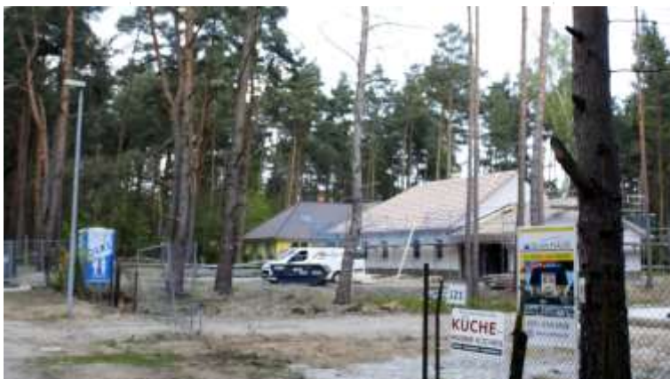
Grundstücke sind begehrt in Beelitz. Die Stadt schafft derzeit auf weiteren Teilbereichen in Beelitz und Fichtenwalde Baurecht.

Zahl der Sterbefälle lag zwar auch im vergangenen Jahr mit 122 wieder höher als die der Geburten, was klar von einer älter werdenden Bevölkerung auch in Beelitz kündigt, dafür übersteigt die Zahl der Zuzüge mit 633 die der Wegzüge. Im vergangenen Jahr meldeten 594 Beelitzer ihren Wohnsitz in der Spargelstadt ab, weniger als im Vorjahr. „Die Zahl