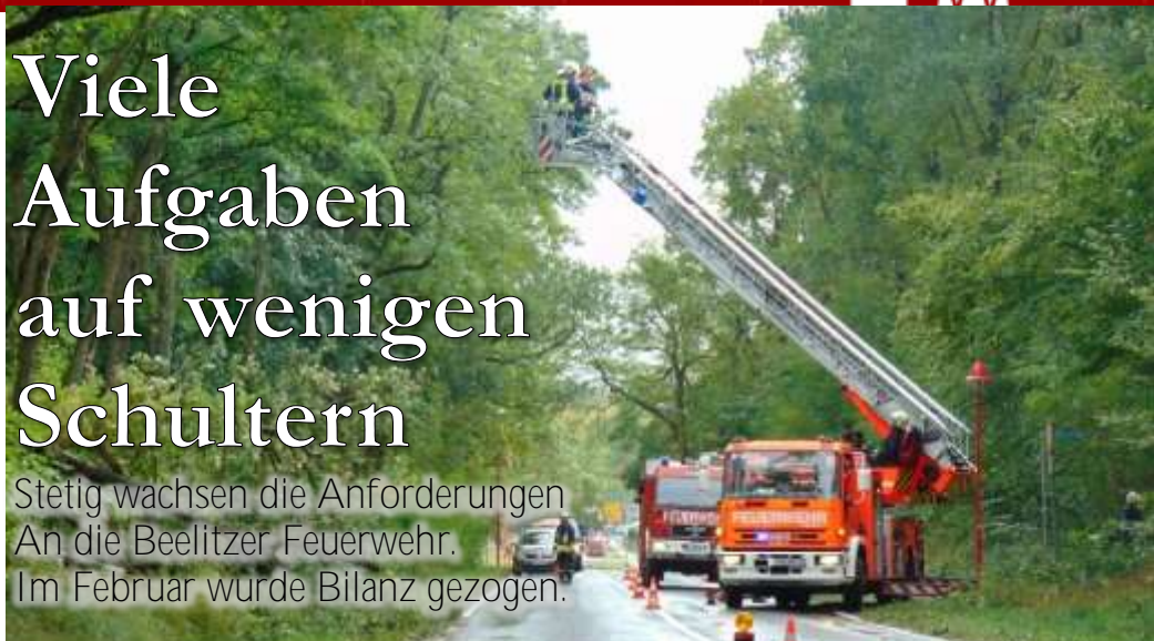
Einsatz während der Unwetter im Herbst 2017. Kleines Bild: Beförderungen bei der ersten gemeinsamen Jahreshauptversammlung aller Ortswehren.

Stetig wachsen die Anforderungen an die Beelitzer Feuerwehr. Im Februar wurde Bilanz gezogen.