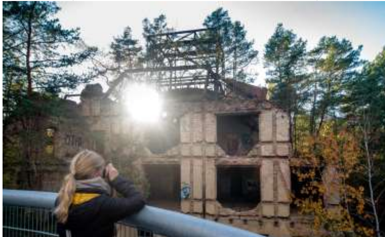
Spannende Aus- und Einblicke - seit Anfang März jetzt auch wieder unter der Woche ab 10 Uhr auf dem Baumkronenpfad und dem umliegenden Parkareal.

Hinter den Kulissen hat sich vor allem organisatorisch Einiges getan: Die Gastronomie wurde in die eigenen Hände genommen und baulich erweitert, versorgt die Gäste fortan mit selbst entwickelten Produkten und jenen von regionalen Partnern. In das alte Pfortnerhaus ist in des ein eigenes Service-Center eingezogen, wo man sich künftig erste