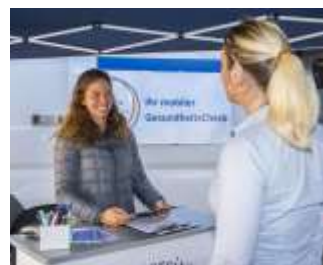
Ein Info-Gespräch sowie Blutprobe, Aufnahmen der Körpermaße und ein Fragebogen beinhaltet der Gesundheitscheck.

„Ziel der Studie ist neben der Verbesserung des Gesundheitszustands Betroffener auch, Ursachen und Risikofaktoren des Metabolischen Syndroms mobil und wohnortnah zu erfassen, bezüglich Bewegung und Ernährung zu beraten und schulen,